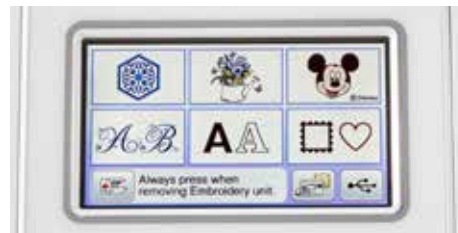
Écran tactile LCD couleur