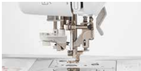
Système d'enfilage de l'aiguille avancé