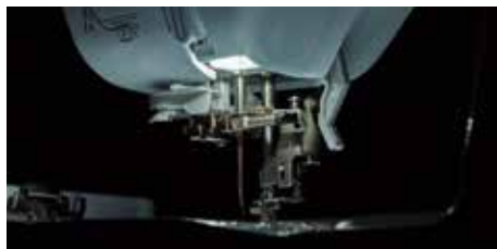
Éclairage LED super lumineux