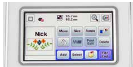
Combinaison de motifs de broderie pour plus de créativité