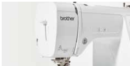
Touches de contrôle à portée de main