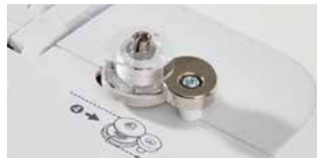
Système de remplissage de la canette facile