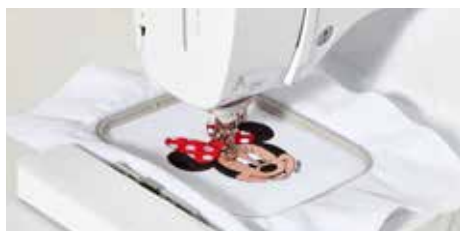
Champ de broderie de 100 x 100 mm