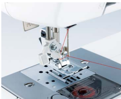
Enfilage facile et automatique de l'aiguille