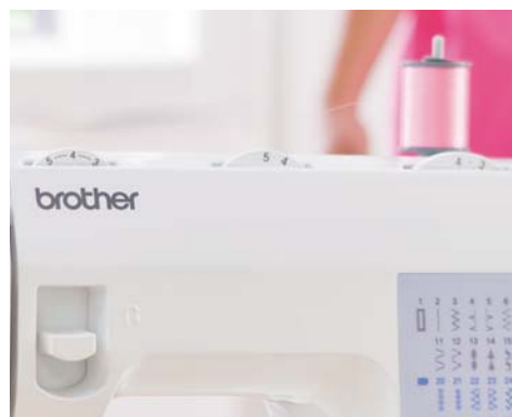
Longueur et largeur de point réglables

Pour plus d'informations, contactez votre spécialiste ou rendez-vous sur www.brothersewing.eu .