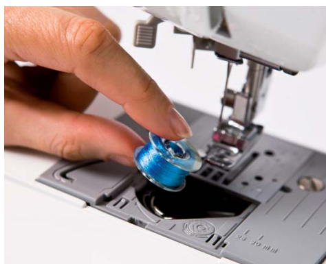
Mise en place rapide de la canette - placez tout simplement une canette pleine et vous pouvez commencer à coudre